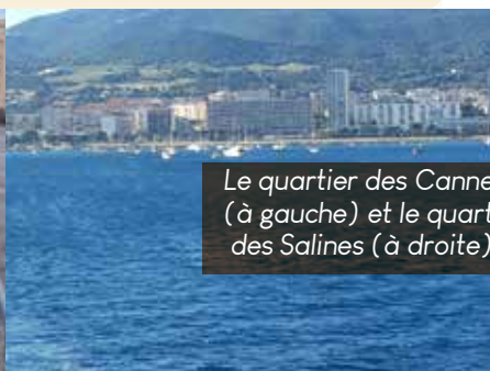
Le quartier des Cannes (à gauche) et le quartier des Salines (à droite).