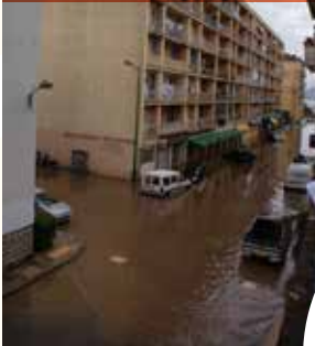
La Rue Bonardi vue de l'amont le 30 mai...

Aux Cannes, la situation a été différente mais ce sera l'autre quartier le plus touché. En effet, grâce au type d'habitat (immeubles), la population a été moins en danger mais les dégâts ont été très importants. L'Arbitrone et ses affluents ont ainsi inondé certaines rues, comme la rue Bonardi (exutoire du bassin) sous 1m50 d'eau.