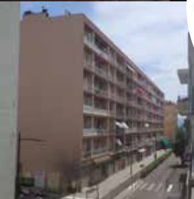
...et aujourd'hui.