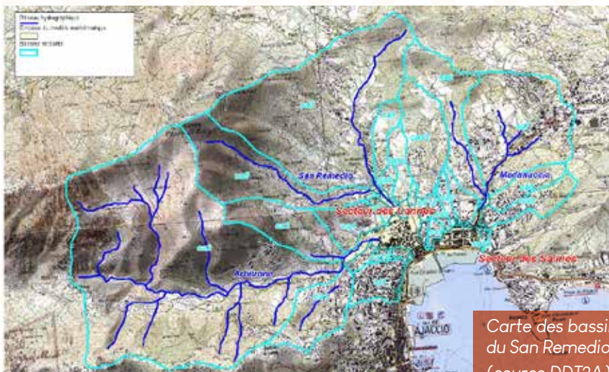
Carte des bassins versants de l'Arbitrone, du San Remedio et de la Madonuccia