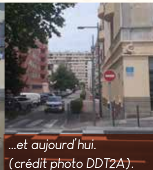
...et aujourd'hui.

Cette hauteur s'explique par les nombreux obstacles que les eaux de débordement et de ruissellement urbain ont rencontré, à savoir :