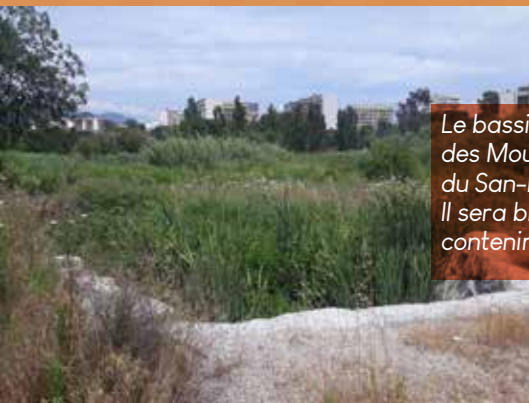
Le bassin Alzo di Leva I sur le ruisseau des Moulins Blancs, affluent du San-Remedio, à l'entrée des Cannes. Il sera bientôt réaménagé pour pouvoir contenir 10 000 m 3 d'eau.

Aussi, la Ville consciente de cet état de fait, a engagé d'importants travaux dans les secteurs lourdement affectés par la crue de 2008. Ce programme ambitieux se poursuit encore aujourd'hui avec de lourds investissements financiers.