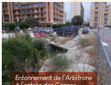
Entonnement de l'Arbitrone à l'entrée des Cannes.