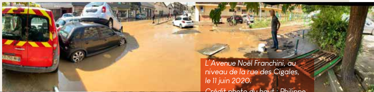
L'Avenue Noël Franchini, au niveau de la rue des Cigales, le 11 juin 2020.

Le quartier des Cannes , cette fois-ci n'a pratiquement pas été touché . L'orage l'a survolé brièvement et les bassins et exutoires déjà réalisés ont joué leur rôle. En revanche, aux Salines , c'est un vrai torrent qui a déferlé notamment le long de l'avenue Noël Franchini qui longe la Madonuccia. Il a emporté véhicules et poubelles , inondé de nombreux rez-de-chaussée, de commerces et d'entreprises, des caves et des garages et un lycée, mais là aussi, aucune victime n'a été à déplorer.