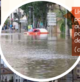
Un véhicule des sapeurs pompiers en mauvaise posture au milieu de l'eau retenue par le mur de la voie de chemin de fer boulevard Jean Nicoli.