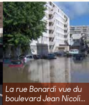
La rue Bonardi vue du boulevard Jean Nicoli...