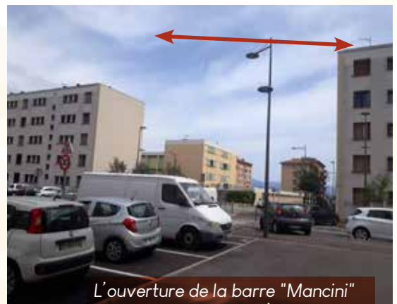
L'ouverture de la barre "Mancini" qui barrait la route à l'Arbitrone.

Il s'appuie, par endroits sur quelques bassins naturels existants mais encombrés de végétation ou de déblais et sous-dimensionnés. Ces bassins, dont les capacités vont de 1 000 m 3 (bassin de la ZAC de Suartello) à 19 000 m 3 (bassin Peraldi sur la rocade), seront tous calibrés sur la crue de période de retour 25 ans du PPRi. Par ailleurs, les exutoires et réseaux en aval des bassins ont été redimensionnés sur des crues comprises entre des périodes de retour 50 ans à 100 ans (selon le PPRi de 2011) selon les cas.